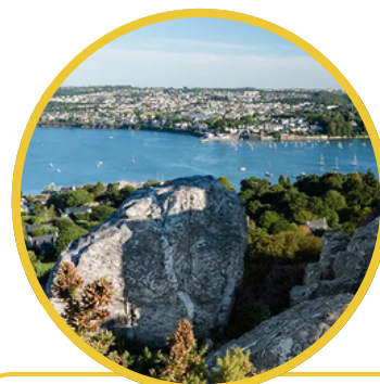
Adopter le regard d'un explorateur