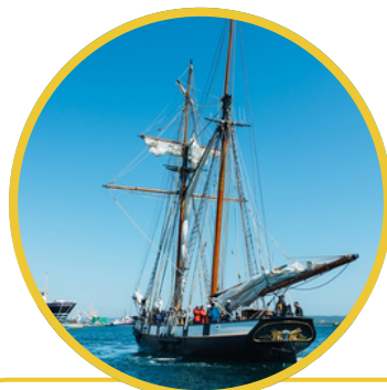
Promenade maritime en rade de Brest