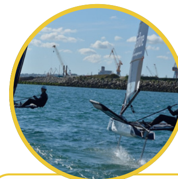
Le spot idéal pour les sports nautiques