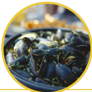
Découverte gustative des produits locaux