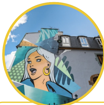
Entre art et culture