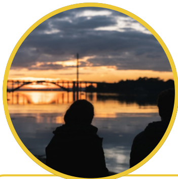
Soirée Sunset près du pont Albert Louppe