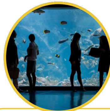
Océanopolis, le Centre de Culture Scientifique dédié à l'Océan