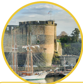
Le château de Brest et son musée de la marine

Poursuivez votre séjour en vous offrant une parenthèse brestoïse : nature préservée, patrimoine d'exception et art de vivre local vous attendent à Brest !